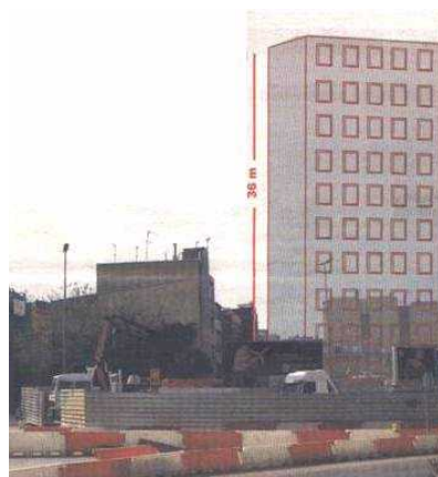
Edifici d'11 plantes al passeig Sant Antoni.

El pla de l'estació comporta a més a més una ampliació de l'espai que aquesta ocupa. Això suposa la disminució i desviació dels vials que l'envolten, així com l'enderroc de pràcticament la meitat dels edificis (tallers i magatzems majoritàriament) que composaven el carrer Viriat. En un dels solars que aquesta obra deixarà s'hi construirà un edifici de 15 plantes i de 19.334,14m 2 . Per una altra part, al carrer Vallespir diversos edificis del barri que contenen habitatges i comerços, també seran enderrocats i s'hi construirà un hotel.